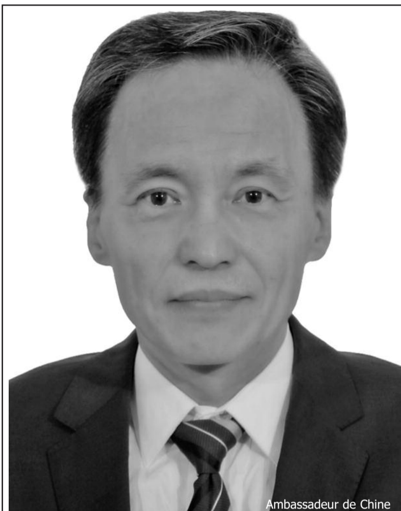
Ambassadeur de Chine

Les Perspectives économiques mondiales publiées par la Banque mondiale en janvier 2019 ont révisé à la baisse les prévisions de croissance économique mondiale pour 2019 à 2,9%, citant les frictions commerciales continues comme un risque majeur à la baisse. Le Fonds monétaire international a également réduit sa prévision de croissance économique mondiale pour 2019 à 3,3% dans son rapport sur les perspectives de l'économie mondiale publié en avril 2019, contre une estimation de 3,6% en 2018, suggé-